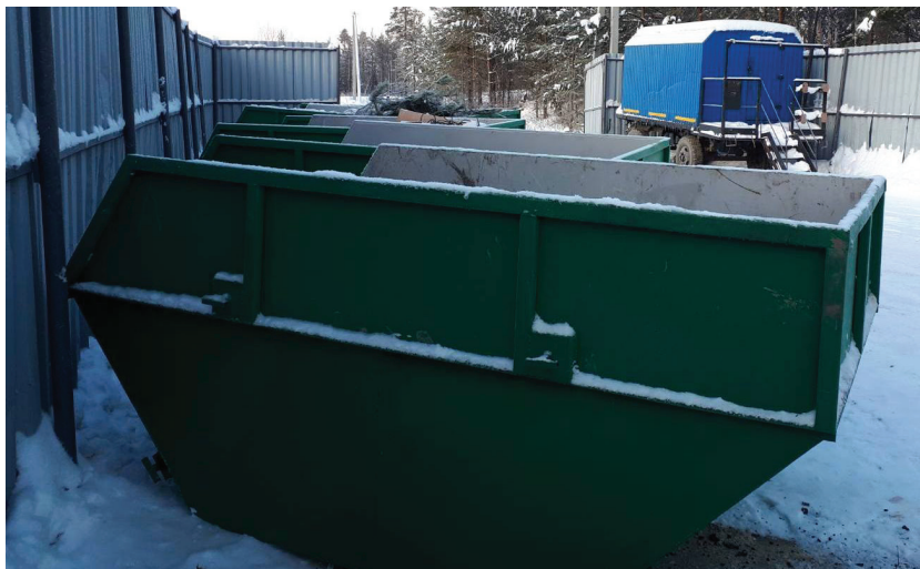
Фото 4. Контейнерная площадка по сбору ТБО и крупногабаритных отходов