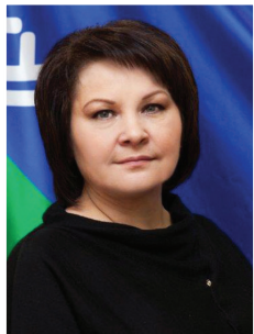
Кокарева Римма Тимергалеевна – заместитель главы города Нягани

По итогам 2018 года наш город занял 1-е место в рейтинге реализации механизмов по повышению доступа негосударственных организаций к предоставлению услуг в социальной сфере среди 13 городских округов.