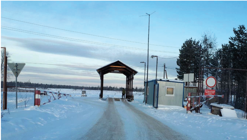
Фото 1. Полигон ТКО г.п. Советский. Объем 454 444 тыс. м³, мощность 66 500 м³/год