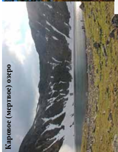
Каровое (мертвое) озеро