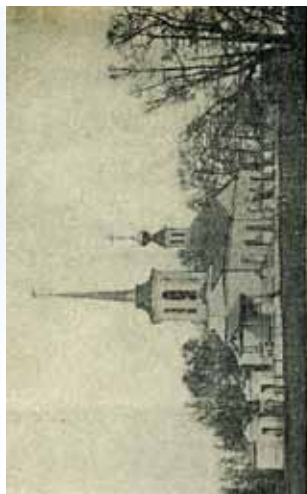
Боржом. Троицко-Исидоровская (Заручинская) церковь, возведена в 1778 году.