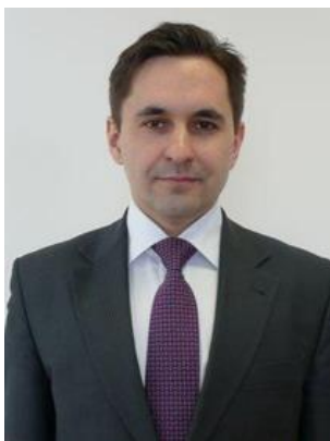
Мурсаяпов Рустам Рифович – директор Департамента жилищной политики Ханты- Мансийского автономного округа - Югры

Целевой программой предусмотрено две формы государственной поддержки граждан, проживающих в приспособленных помещениях: