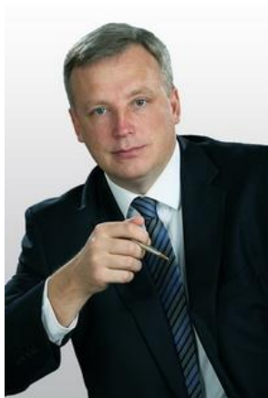
Бондаренко Сергей Афанасьевич - председатель Думы города Сургута

В 2006 году в целях урегулирования размещения движимых объектов на территории муниципального образования городской округ город Сургут издано постановление Администрации города от 01.03.2006 №230 «Об утверждении порядка предоставления земельных участков, установки, монтажа и сдачи в эксплуатацию движимых (временных) объектов на территории города и о внесении изменений в постановление Администрации города от 27.06.2005 №84»