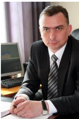
Клец Максим Витальевич - глава города Нижневартовска