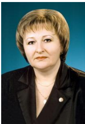
Говорищева Алла Юрьевна - председатель Думы города Когалыма