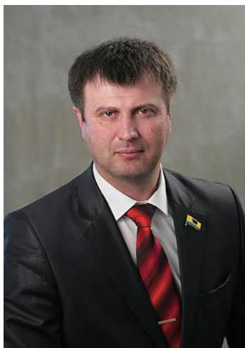
Бурчевский Виталий Анатольевич – глава города Нефтеюганска

«О реализации подпрограммы пятой целевой программы Ханты-Мансийского автономного округа - Югры «Улучшение жилищных условий населения Ханты-Мансийского автономного округа - Югры на 2011 - 2013 годы и на период до 2015 года» в части предоставления субсидий гражданам, до 1995 года вселившимся в помещения, находящиеся в строениях, расположенных в границах населенных пунктов автономного округа (за исключением строений, установленных на земельных участках, относящихся к частным домовладениям, а также на садовых, огородных и дачных участках) и не отнесенных в соответствии с положениями статьи 16 Жилищного кодекса Российской Федерации к жилым помещениям, проживающих в этих помещениях в настоящее время, а также членов семей указанных граждан, проживающих совместно с ними в настоящее время, при условии отсутствия у таких граждан и членов их семей жилых помещений, принадлежащих им на праве собственности или занимаемых ими на основании договоров социального найма на территории Российской Федерации»