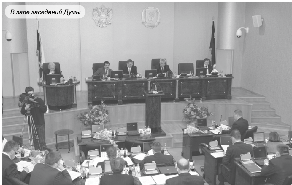
В зале заседаний Думы

1. Депутаты Думы Ханты-Мансийского автономного округа – Югры (далее также – Дума автономного округа), избранные по многомандатному избирательному округу, составляют Ассамблею представителей корен-