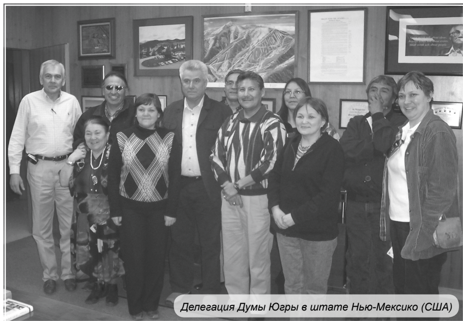
Делегация Думы Югры в штате Нью-Мексико (США)