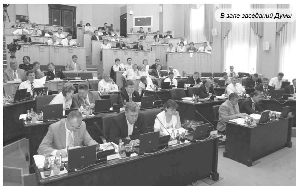
В зале заседаний Думы

1. В состав Ассамблеи входят депутаты Думы автономного округа, в том числе председатель Ассамблеи и заместитель председателя Ассамблеи.