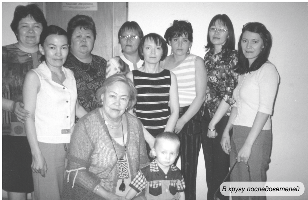
В кругу последователей