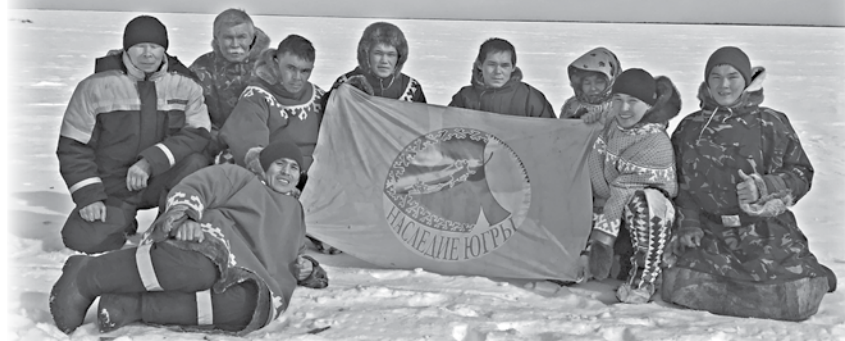
Поездка на озеро Нумто

В июне мы организовывали сплав на облаках по озерам и рекам Сургутского района, общей протяженностью более 40 км. Идею заимствовали у наших предков, ведь раньше облак был единственным средством передвижения по воде. Преодолев дистанцию по озеру, переносили облака по болоту до другого водоема и так далее. Зато какие красивые места удалось увидеть!