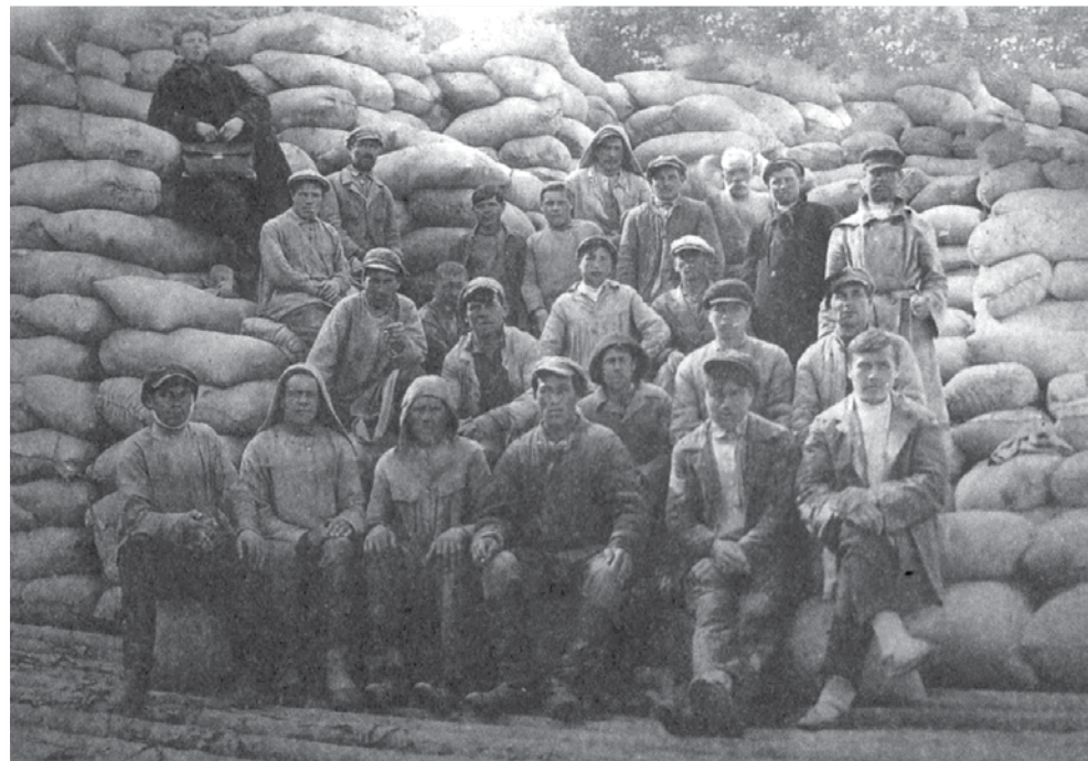
Хлеб, привезённый в г. Берёзов из Омска для отправки в Ляпино.

вым рыночным предприятием гражданской войны».