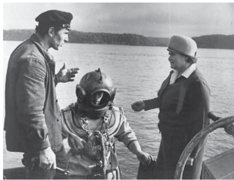
Во время беседы с водолазами при прокладке первой нитки газопровода через р. Обь близ с. Перегребное, 1970 г.