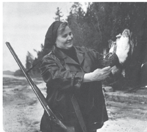
На охоте, 1970 г.