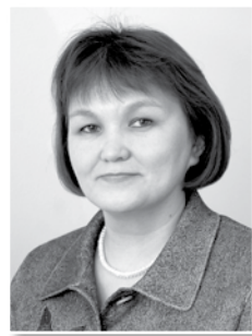
Татьяна Гоголева, депутат Государственной Думы ФС РФ

Верю, что развитие волонтерского движения в России будет способствовать формированию крепкого гражданского общества.