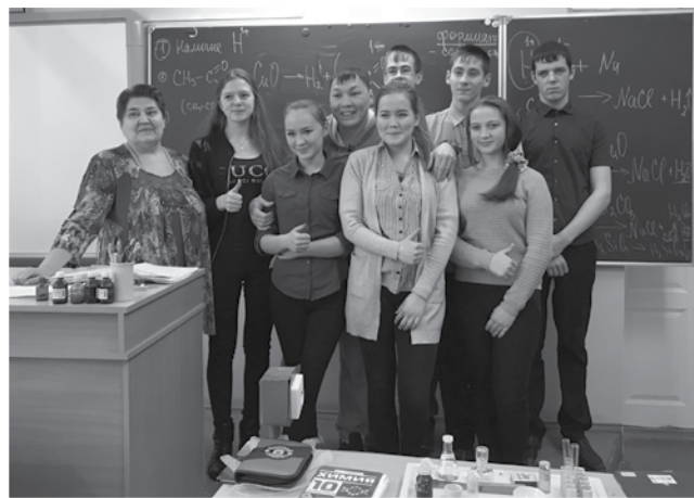
В школе п. Няксимволь

Проведение встреч с избирателями по месту их жительства и прямое общение с избирателями