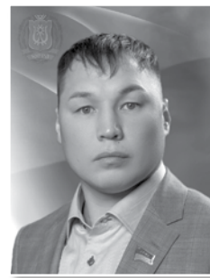
Руслан Проводников, депутат Думы ХМАО – Югры

«Волонтерская деятельность – одна из самых эффективных форм вовлечения подростков и молодежи в социальную жизнь. Развитие добровольческого движения играет важную роль в становлении активной гражданской позиции в обществе. В Березовском районе действуют несколько волонтерских объединений, которые работают на базе образовательных учреждений, учреждений дополнительного образования, центров социального обслуживания и культуры и досуга, а также на общественных началах. Их деятельность – это участие в экологических, спортивных, патриотических акциях и мероприятиях, помощь пожилым людям, ветеранам и многое другое. Понимая важность развития добровольческого движения, всегда стараюсь поддерживать и по возможности участвовать в реализации социальных инициатив и волонтерской деятельности.»