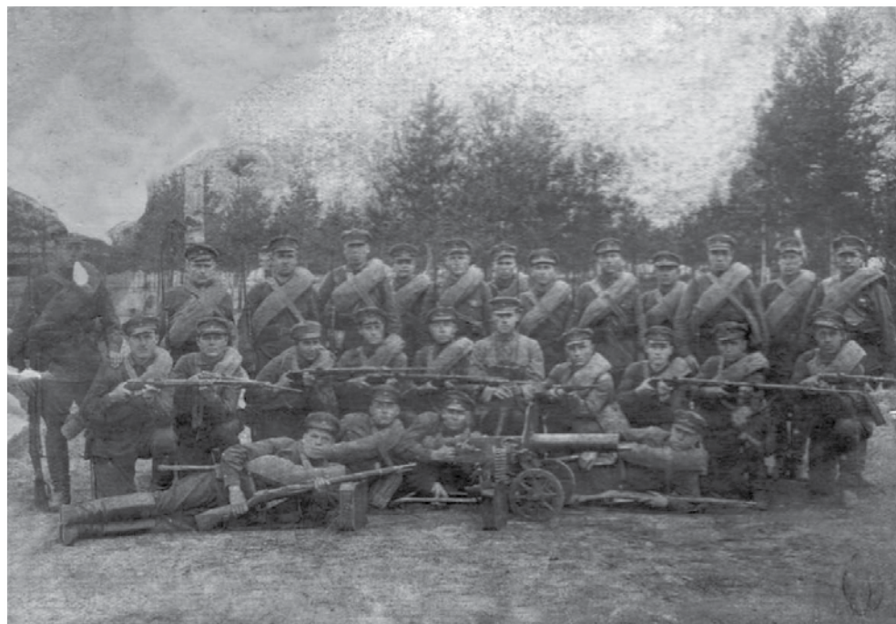
Солдаты Красной Армии.