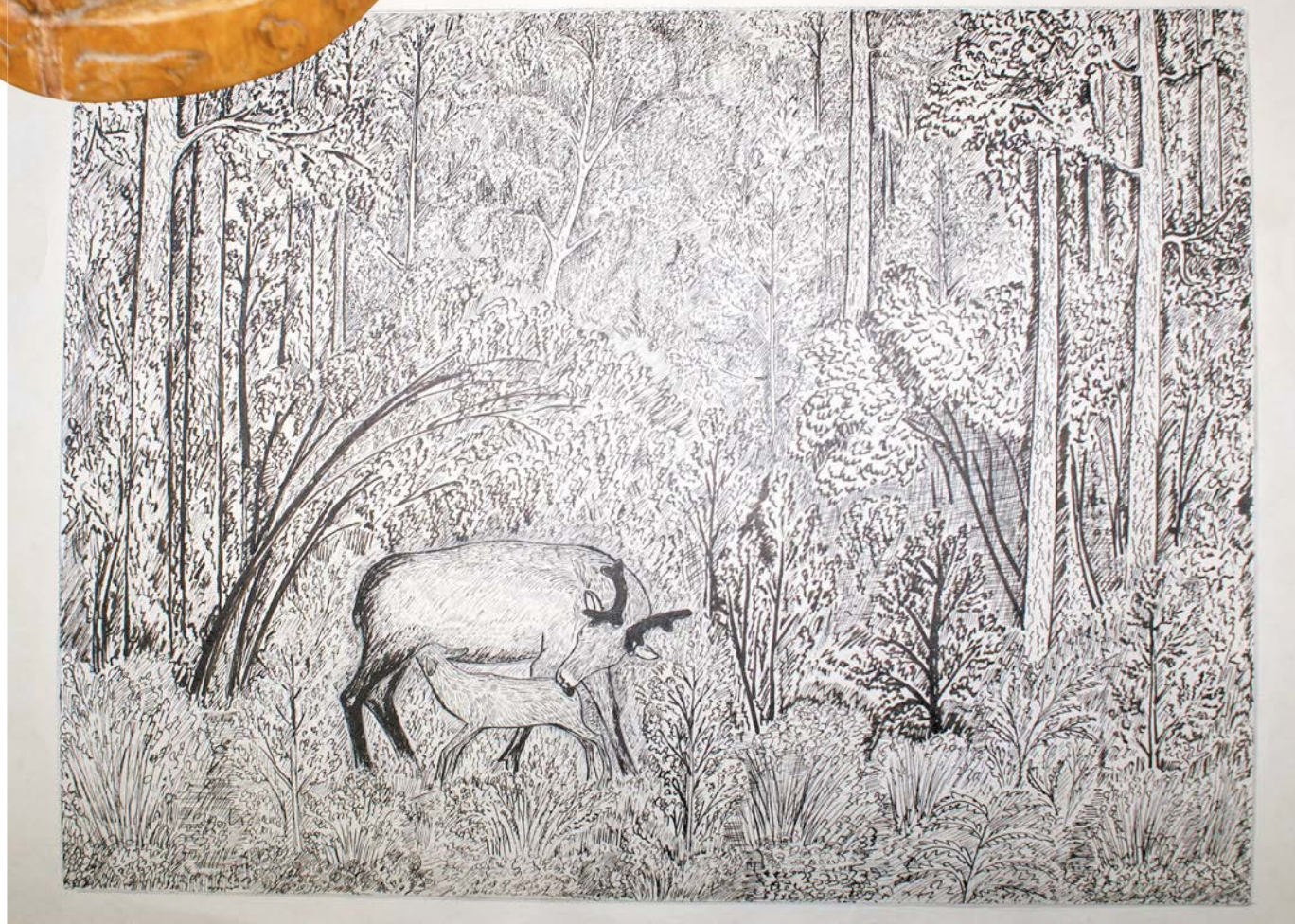
В лесу родился оленёнок