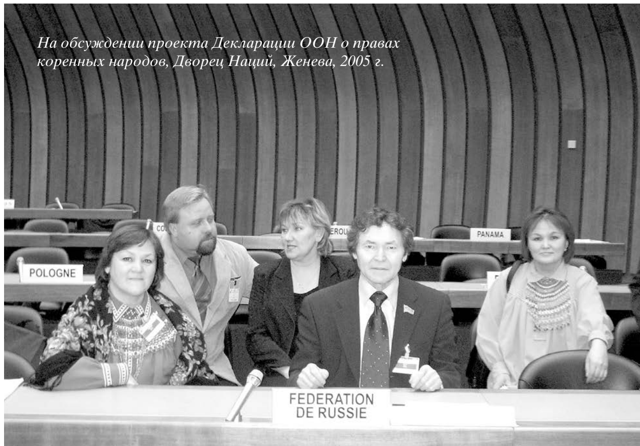
На обсуждении проекта Декларации ООН о правах коренных народов, Дворец Наций, Женева, 2005 г.

Вокруг идеи возрождения обских угров собралось много единомышленников. Время было непростое. Тогда казалось: не осталось места на земле нашим сородичам. Для жизни. Для дыхания. Освоение природных ресурсов, которое началось в 1960-70-е гг., к тому времени стало прямой угрозой традиционному образу их жизни. Сокращались пастбища, по путям сезонных миграций северного оленя прокладывались трассы трубопроводов, по соседству с родовыми угодьями на табуированных землях древних святынь вырастали вышки.