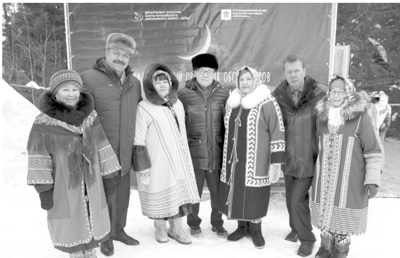
В «Торум Маа» – духовном центре общин угров

На мой взгляд, снижение темпов формирования федерального законодательства о гарантиях прав коренных народов происходит еще и потому, что стало меньше представителей этих народов в высших органах власти – некому отстаивать права и интересы своих соотечественников. В Госдуме предыдущего созыва, например, такими представителями являлись лишь югорчанка Татьяна Гоголева и ямалец Григорий Ледков , в то время как в союзном парламенте практически все автономии имели своего представителя. В настоящее время