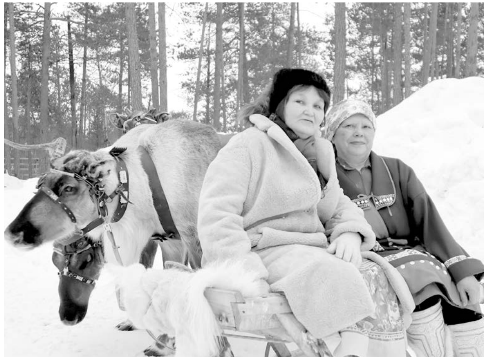
Традиционная культура – самая эффективная защита земли и коренных народов

жизни. Перед напором индустриального освоения Севера, начавшегося в 1960-е годы, таежные семьи оставались совершенно беззащитными. Вернётся оленевод домой, и не найдёт его, только увидит перевёрнутые лабы на обочине дороги, – так было.