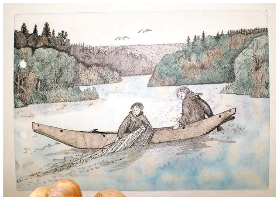
С сыном на рыбалке

Лишь на другой день я узнал, что в дом Петра Ефимовича на Сосьве ударила молния. И он погиб от молнии. Объяснили это тем, что в доме было много включённой в электросеть радиоаппаратуры. Он много работал. Прослушивал, переписывал, обрабатывал тексты песен, сказаний, мифов. Он всё время был в работе, в творческом поиске, творил.