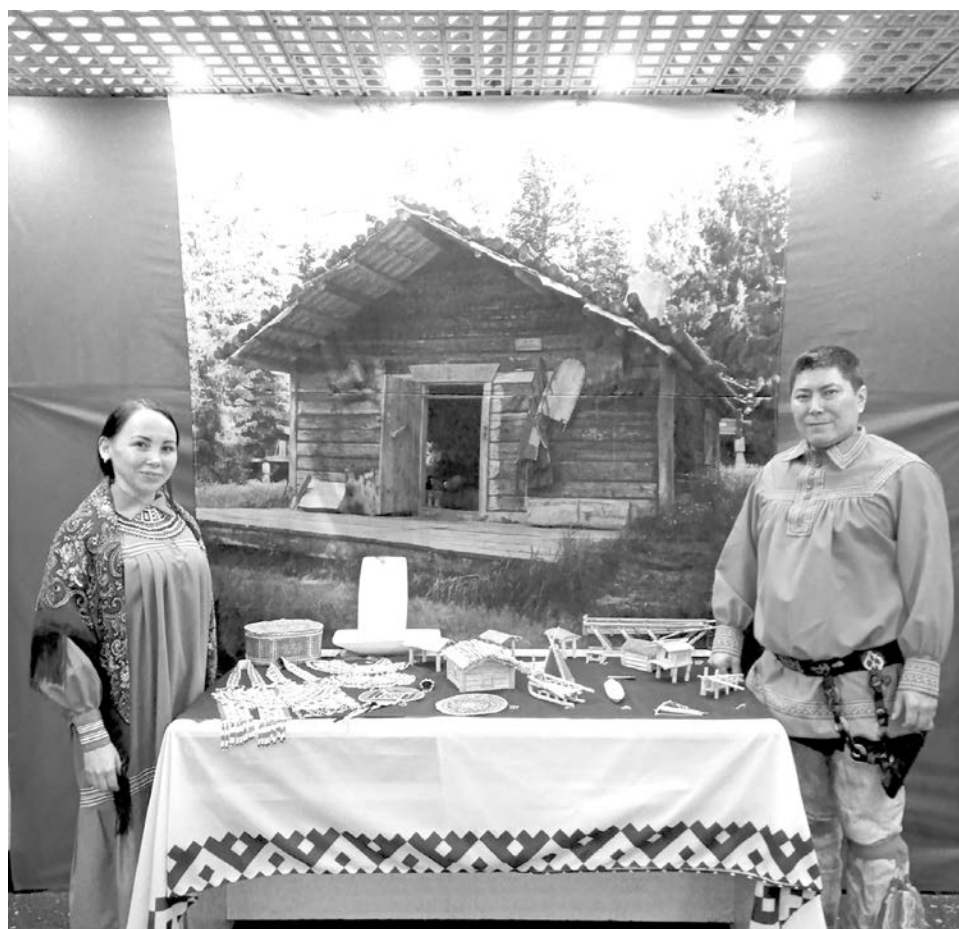
Игрушки и головоломки обских угров из «Волшебного сундучка», книга с дополненной реальностью «По дороге на стойбище» стали центром притяжения экспозиции музея «Торум Маа»

рассказывали египтяне. Местные жители – добрые, отзывчивые люди, несмотря на языковой барьер мы с ними пытались друг друга понять. В целом поездка в Египет прошла отлично, мы очень рады, что у нас появилась возможность представить нашу культуру и мастерство, рассказать о быте и жизни северных народов на международной площадке, и, конечно же, пригласить к нам на Север!