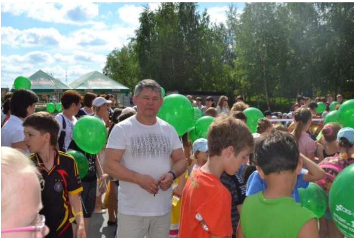
Субботник в городках УБР, МДРСУ, МССУ города Мегиона, в котором приняли участие члены ЛДПР и жители городков