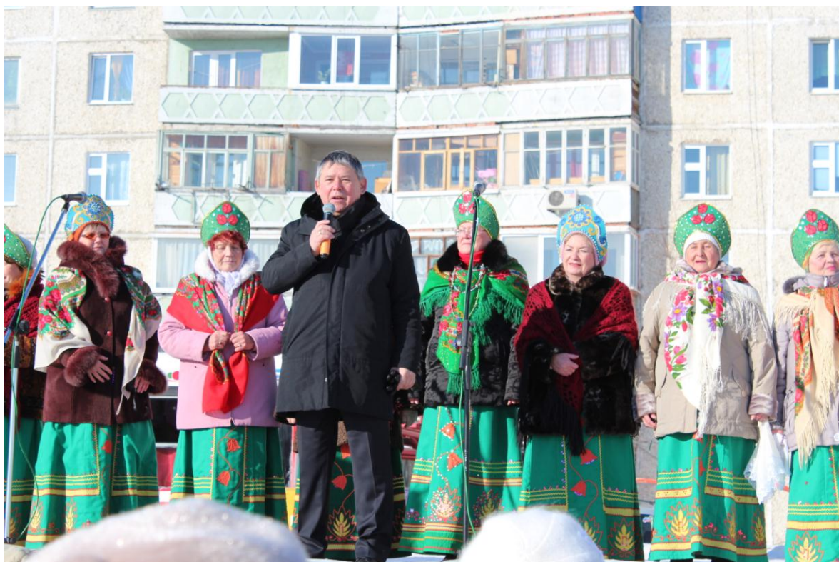
Спортивное мероприятие - соревнования среди многоборцев в честь 23 февраля