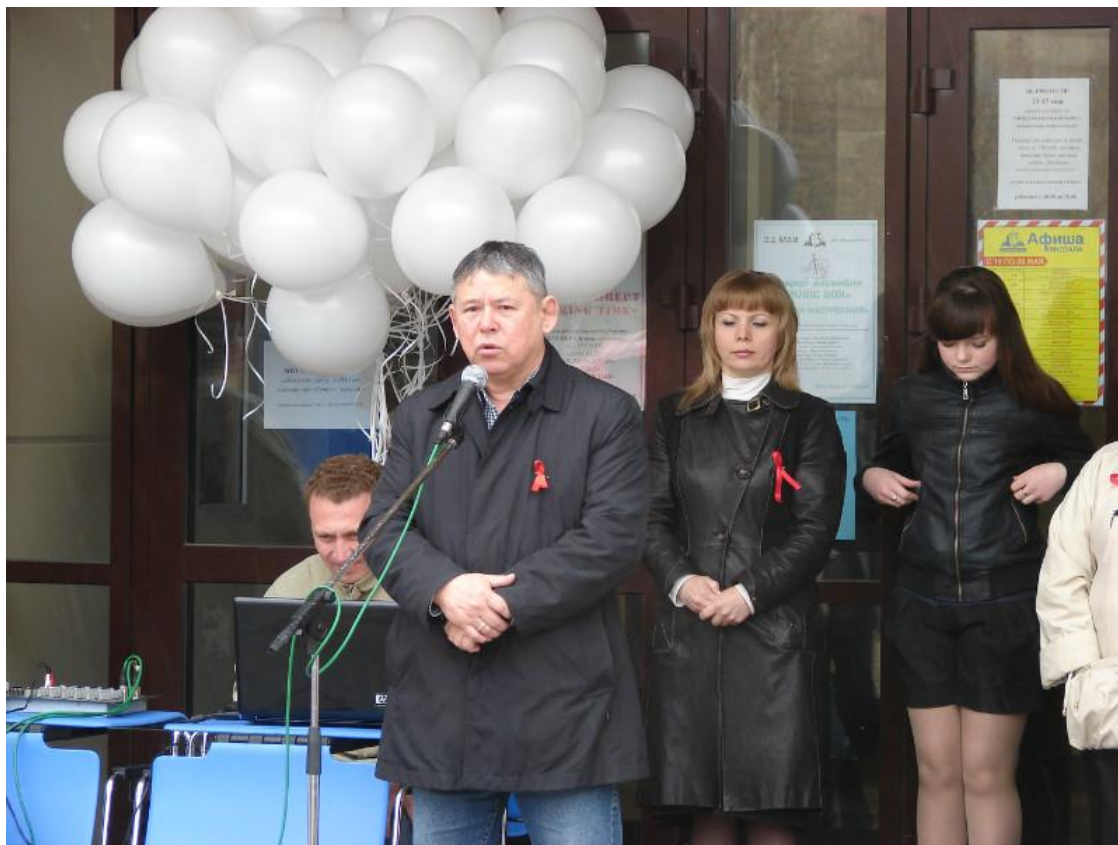
Торжественная линейка, посвященная закрытию Ледового сезона 2011 – 2012 годов в спорткомплексе СК «Юность»