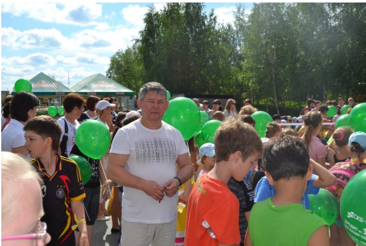
Субботник в городках УБР, МДРСУ, МССУ города Мегиона, в котором приняли участие члены ЛДПР и жители городков