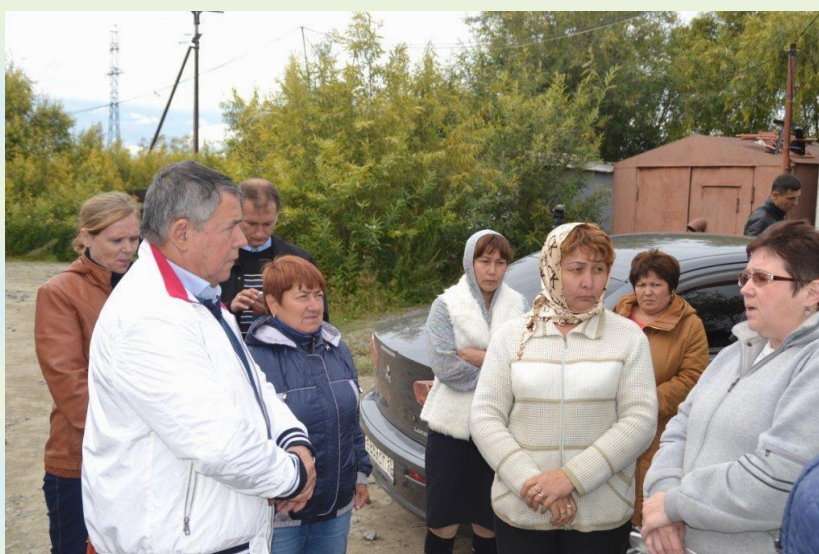
встреча с жителями поселка Дивный

Эти вопросы находятся в приоритетных направлениях депутатов Думы автономного округа в составе фракции ЛДПР.