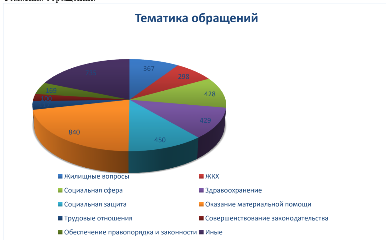
Диаграмма классификации обращений по тематике затронутых вопросов. В диаграмме отражены показатели, имеющие наибольший удельный вес.

Наибольшее количество обращений поступило из Нижневартовска, Сургута, Ханты-Мансийска, Нефтеюганского района.